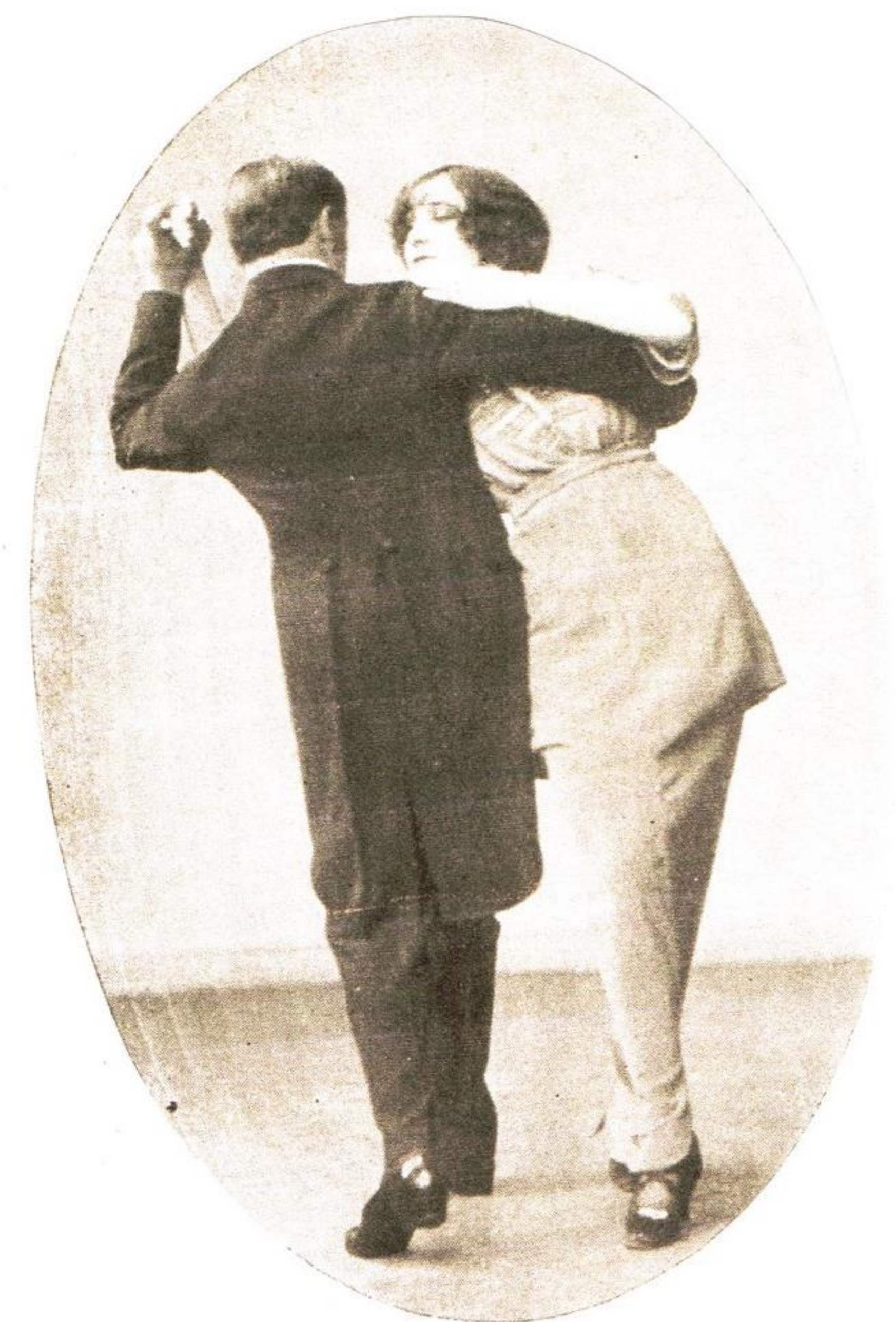
Et "Boston-run" hvor damen er ved siden af herren og bevæger sig baglæns.

"The Boston Two-Step" er enkel: Parvis med front i danseretningen, fodkast fremad med udvendig fod i 3-tælling, 3 skridt frem i 3-tælling, slip håndfatningen og vend ryggen i danseretningen,