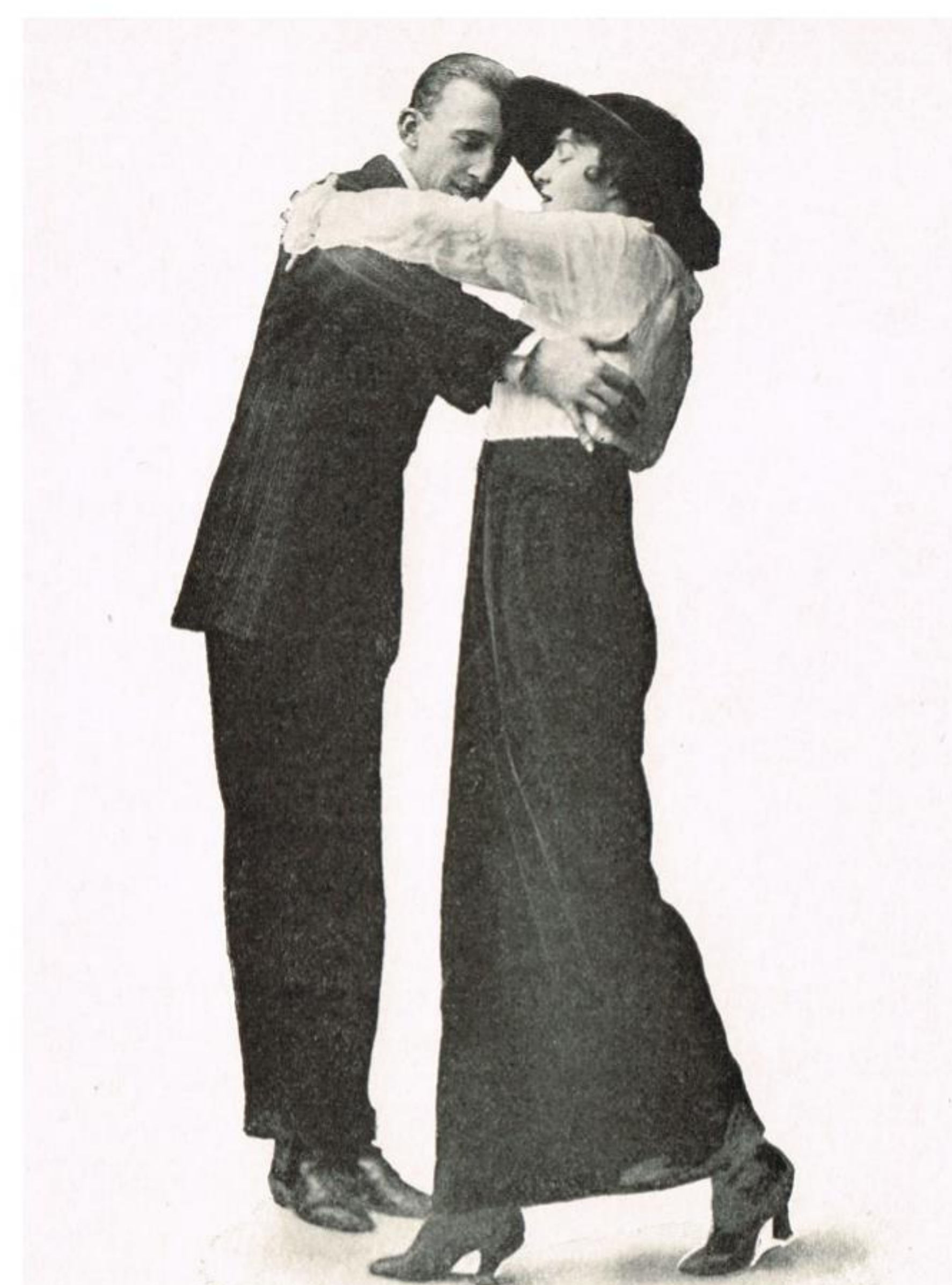
ONE STEP An effective step is when the man stands still for a second while the lady continues for two steps to the side. This picture is the only explanation of this step.

Two-Step var en af de tidligste. Den blev opfundet i USA omkring 1890 og kom til Europa ca. 10 år senere. Den kan vel siges at være banebrydende for moderne dans. Den "skubbende" mange af de gamle danse ud og tog efterhånden over for polkaen – især i 1910-20'erne, hvor man på moderne baller dansede two-step i stedet for polka. Two-step er i grundformen