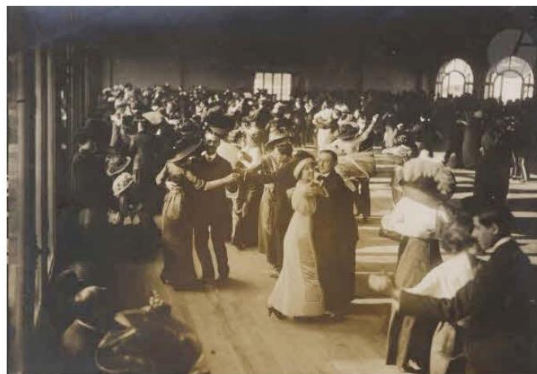
Bal i Paris, 1914 - nok one-step.

Der er flere varianter af trinene i one-step. På billedet f.eks. at herren står stille i 1. position (samlede fødder), mens damen tager 2 skridt til siden. En af one-step varianterne hed "The Hitchy Koo".