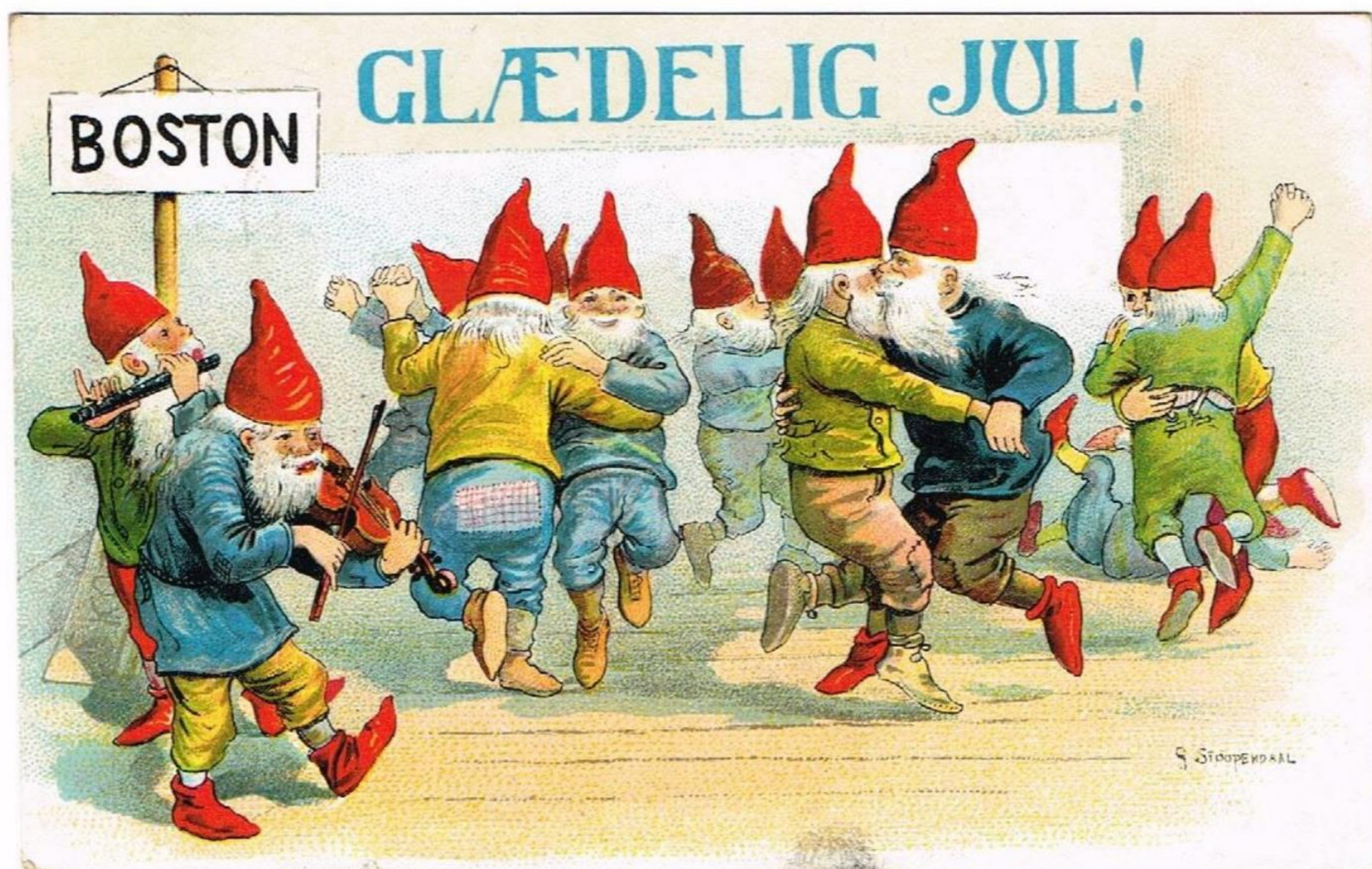
Dansk julekort fra 1909 – nisser danser Boston.